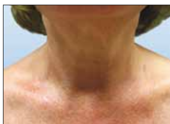
► Jeweils vorher und nach 1 Behandlung mit beautytek light