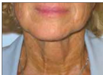
► Vorher und nach 1 Behandlungsserie mit beautytek light